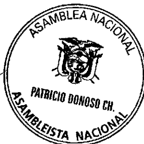
Arg. Patricio Donoso Chiriboga ASAMBLEÍSTA NACIONAL